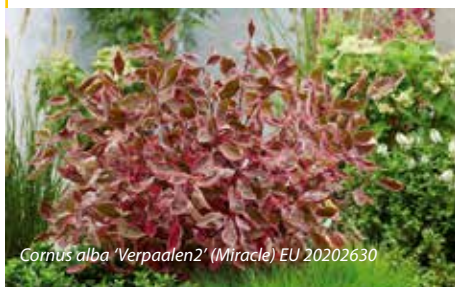
Cornus alba 'Verpaalen2' (Miracle) EU 20202630

Een breed opgaand groeiende struik met enigszins papierachtig blad, grijsgroen met een lichte rand. Later in de zomer kleuren de randen roze, terwijl het hart van het blad purpergroen kleurt. In de herfst wordt deze verkleuring sterker. De wintertwijgen zijn donkerrood.