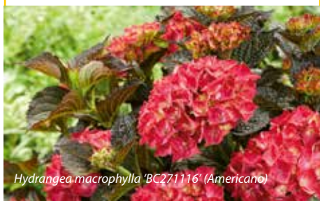
Hydrangea macrophylla 'BC271116' (Americano)

Een brede, ietwat afgeplatte plant, met bloemtuilen die boven het loof gedragen worden. De bladeren zijn opvallend donker van kleur, waartegen de paarsrode bloemen afsteken.