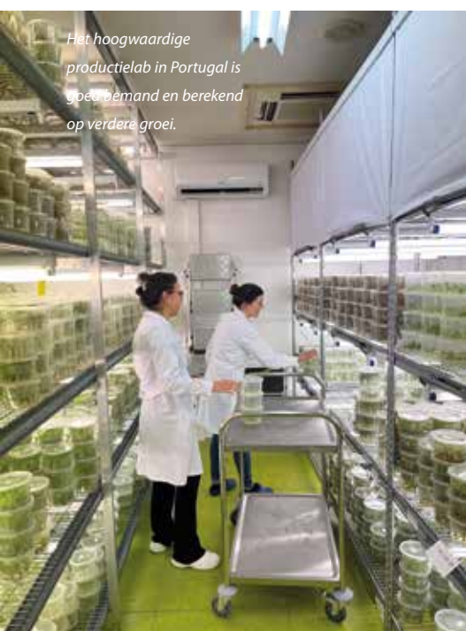
Het hoogwaardige productielab in Portugal is goed bemand en berekend op verdere groei.