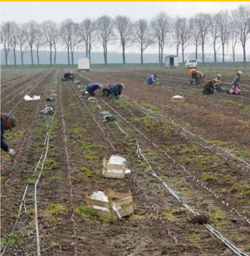
Vele Poolse handen maken licht werk.