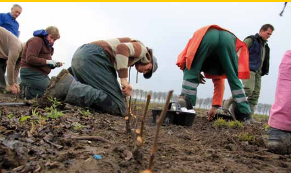
De nieuwe enten zijn zojuist geplaatst.