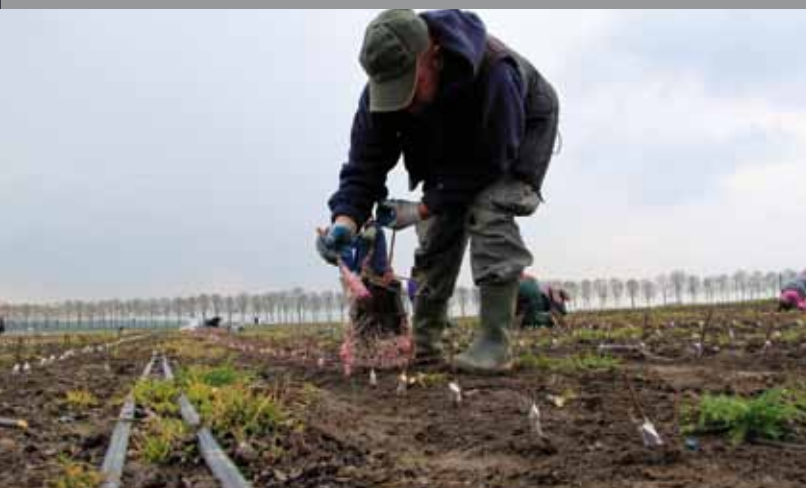
325.000 fruitboompjes-in-wording krijgen een nieuw laagje wax.