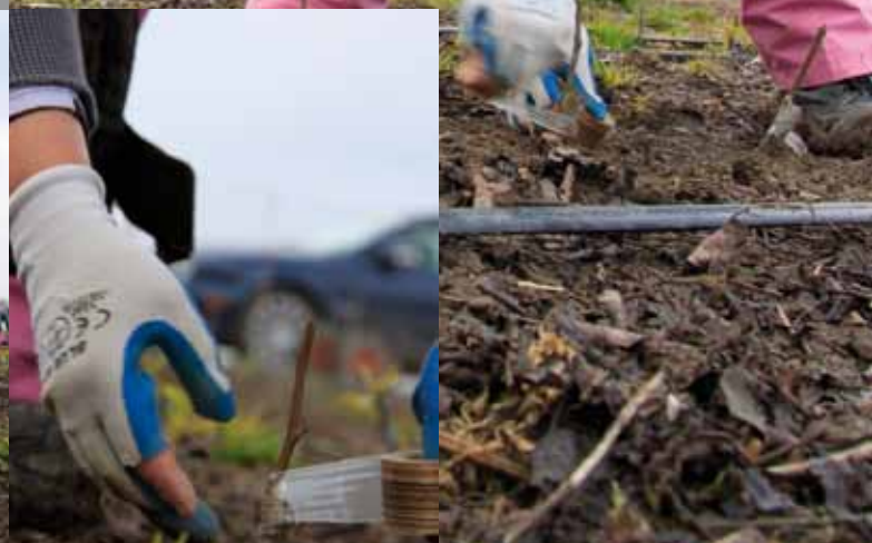
Het aftapen van de nieuwe enten.