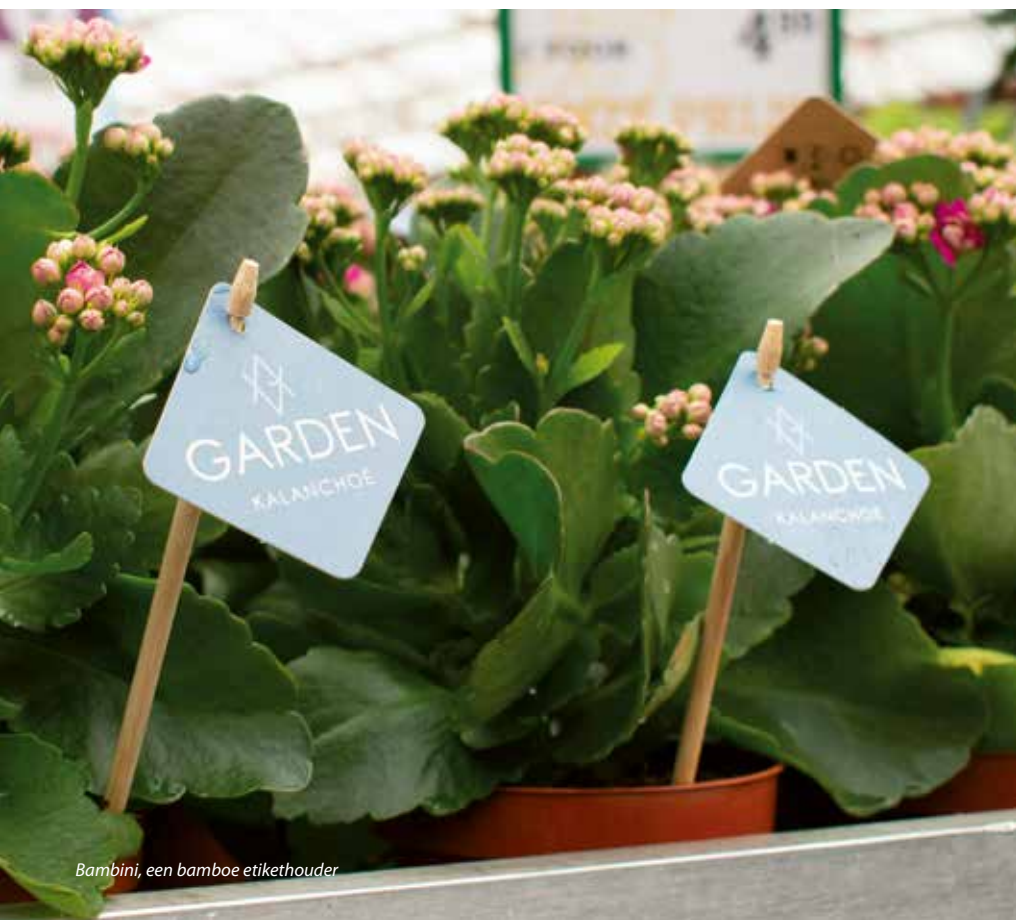
Bambini, een bamboe etikethouder