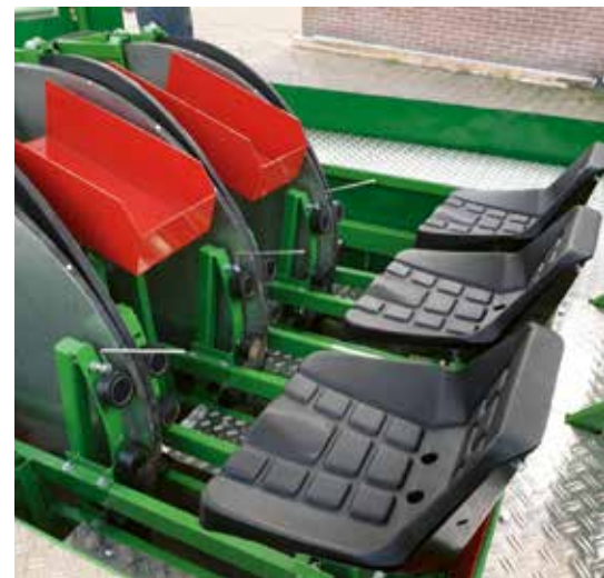
Drierrijige plantmachine met elementen PE120

kistenplateaus, steunwielen, spoormarkeerders, schijfkouters, woeltanden, sleuven- of frees-schijven en een huif. Nieuw is de mogelijkheid om te planten met een elektrische plantafstandsregeling, die uitgebreid kan worden om met gps op afstand in de rij te planten.