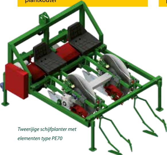
Tweerijige schijfplanter met elementen type PE70