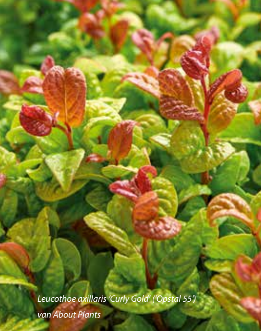
Leucothoe axillaris 'Curly Gold' ('Opstal 55') van About Plants