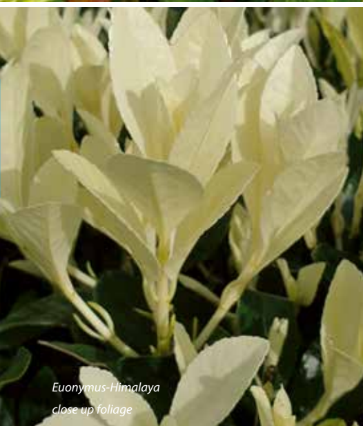
Euonymus-Himalaya close up foliage