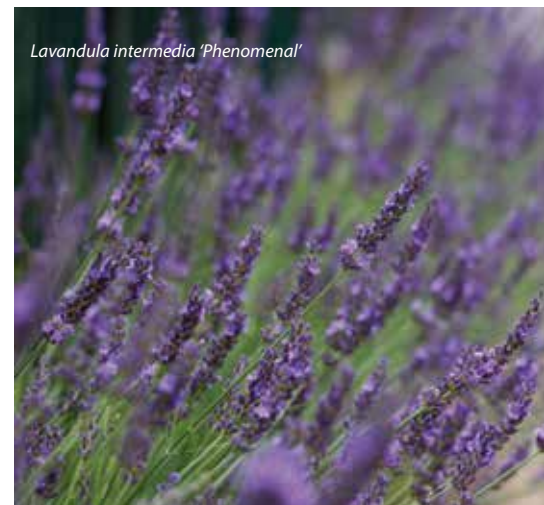
Lavandula intermedia 'Phenomenal'