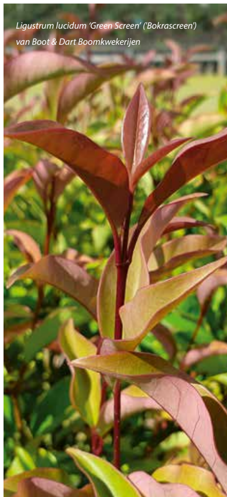
Ligustrum lucidum 'Green Screen' ('Bokrascreen') van Boot & Dart Boomkwekerijen