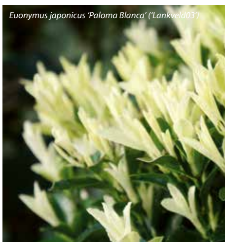
Euonymus japonicus 'Paloma Blanca' ('Lankveld03')

'De populariteit van onze 'White Spire' neemt jaarlijks toe. We leveren ze allemaal uit, tot aan de laatste plant'