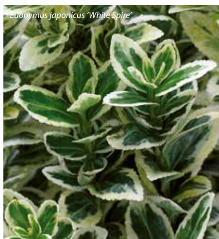
Euonymus japonicus 'White Spire'

'White Spire' is er een met een uniek verhaal. Hij vindt zijn oorsprong in Euonymus japonicus 'Green Spire'. Theo Wouters van Boomkwekerij Wouters ontdekte een opvallende scheut van groene bladeren met een brede witte rand, en besloot deze te vermeerderen en verder te ont-