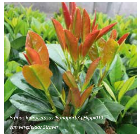
Prunus laurocerasus 'Bonaparte' ('Flippi01') van veredelaar Straver